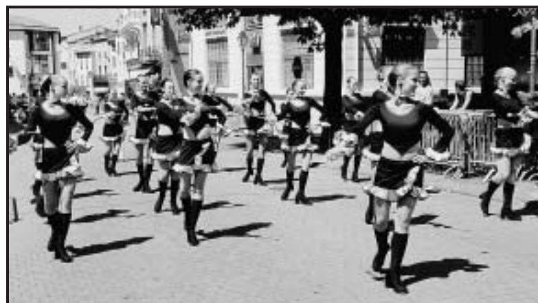
Ve francouzském Mazametu chomutovské mažoretky zazářily. Pořadatele zaujala především jejich precizně sebraná choreografie.

Získané zkušenosti využijí děvčata podle Zelenkové už v září letošního roku na mezinárodním soutěžním festivalu EUROPEAN GRAND PRIX OPOLE v Polsku, kam je nominováno ze Stardance 70 mažoretek třech věkových kategorií. Také malí tanečníci této taneční školy se mají čím pyšnit. Před nedávnem zazářili na Mistrovství světa ve slovinské Ljubljani, kde skupina sedmi dívek získala 4. místo a stejnou pozici obsadila velká formace dvaceti dětí. Jedná se o nejlepší umístění České republiky na mistrovství světa za posledních deset let. (mile)