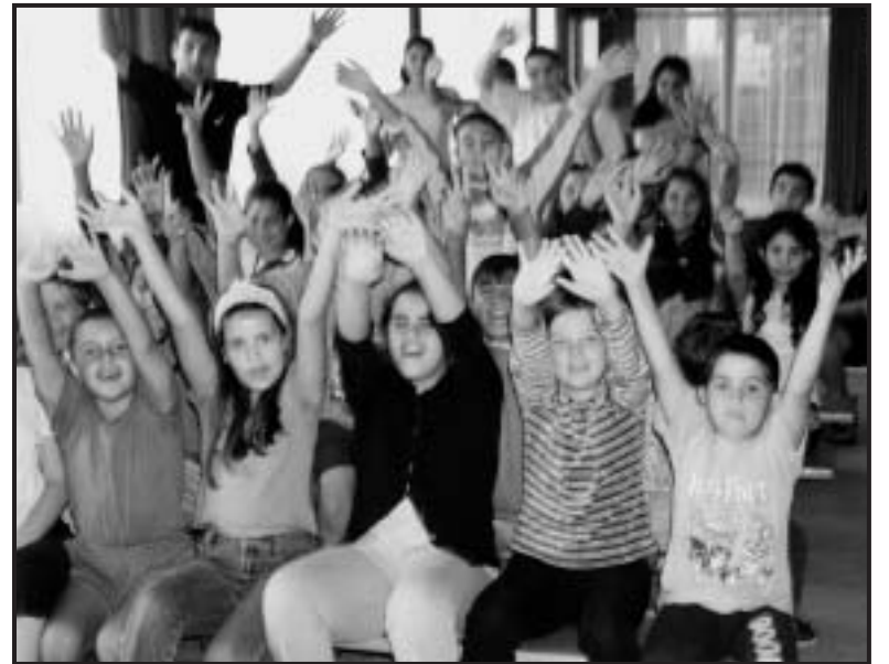
Prostřednictvím fotoaparátu děti zamávaly svým blízkým.