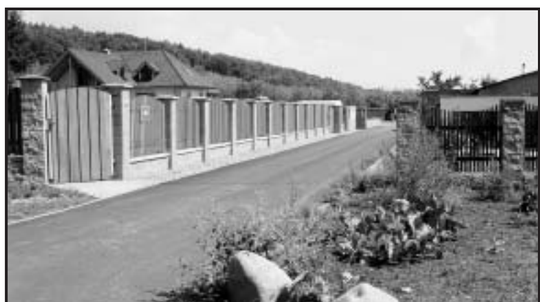
V Letní ulici, jejíž název vznikl teprve v loňském roce, najdete pouze dva domy. Název navrhli sami obyvatelé ulice.

V prostoru sídliště Březencká vedla silnice spojující Chomutov s Březencem. Začínala u sochy, která dnes stojí u železniční zastávky Chomutov-město a pokračovala kolem nynějšího oplocení zooparku do prostoru současné Kundratické ulice. Zde se za rybníčkem stáčela doprava a mířila téměř přímo k mostku přes převaděč mezi dnešní ulicí Hutnickou a Kamenným Vrchem. Tato silnice měla v místě starší chomutovské zastávky původní jméno Pirken Str. podle obce Březeneč (něm. Pirken), vzdálené asi 4 km severně od středu města. V jednom z orientačních plánků pocházejícího z doby před výstavbou sídliště Březencká je uváděn název ulice Březinova , snad podle Otokara Březiny [vl. jm. Václav Jevavý] (1869–1929), prozaisky a jednoho z největších českých novodobých básníků. Tento pramen však nelze považovat za oficiální pojmenování ulice. Úpravou terénu pro výstavbu sídliště původní silnice na Březeneč zanikla a po dokončení obytných domů dostal celý okrsek logicky pojmenování Březencká . Od 1. 5. 1988 dostaly některé ulice na tomto sídlišti své vlastní názvy, ale velké části hlavní komunikace toto jméno právem zůstalo. (klíma)