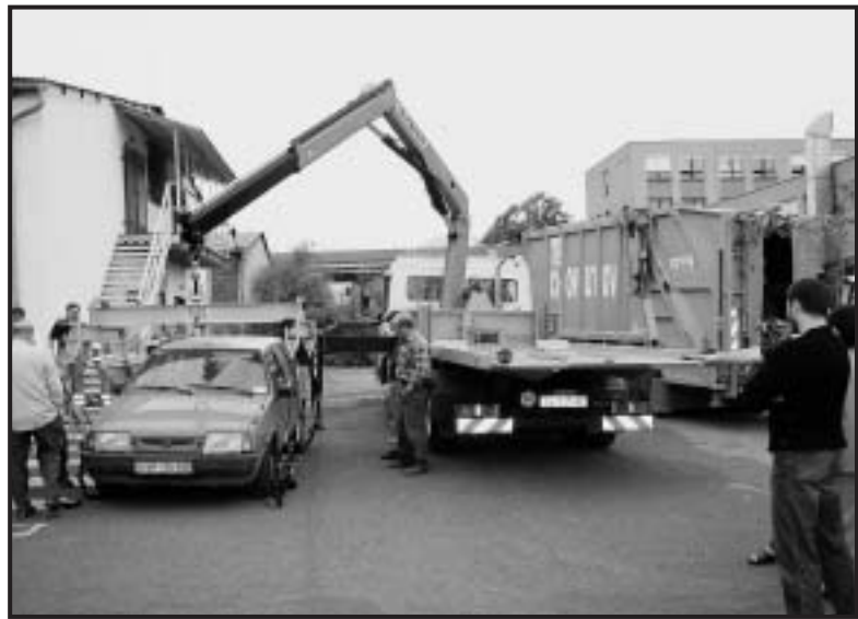
Speciální zdvihač umožňuje naložit i vozy stojící v řadě.

7. Důležitou informací pro občany je, že vůči přestupci bude uplatněn institut zadržovacího práva . Obsluha parkoviště v ul. Kosmova tak vozidlo nevydá, není-li pohledávka uhrazena namístě, popř. není doložen doklad o její úhradě. Majiteli takového vozidla může ovšem nastat komplikace, pokud vozidlo v danou chvíli provozovala jiná osoba. K vydání tedy nedojde, není-li navíc prokázáno vlastnictví (technický průkaz k vozidlu ap.).