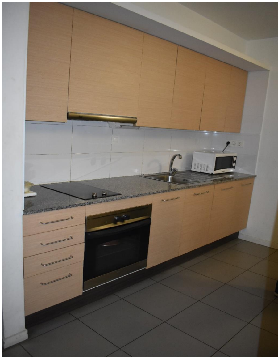
Obrázek č. 9 – každý byt má k dispozici nově vybavenou kuchyň