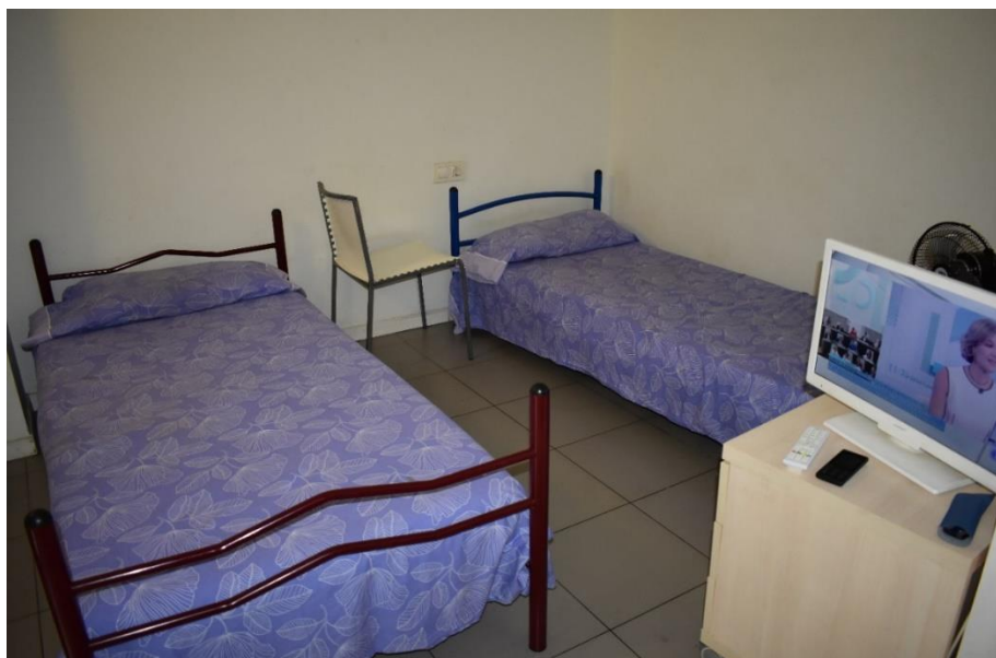
Obrázek č. 8 – ukázka jedné z ložnic

Prohlídka organizace – první a druhé patro domu je obsazené byty, které patří organizaci. Zbylé byty v domě jsou k pronájmu. Dům má dvě společenské místnosti, které jsou určeny pro návštěvy. K dispozici je prádelna, recepce, která funguje 24 h. denně. Některé byty jsou přizpůsobené pro zdravotně postižené klienty – jsou bezbariérové. Byty jsou plně vybavené (např. v kuchyni je nádobí). Byty pouze pro 4 osoby, když má rodina více členů, musí dojít k rozdělení. V každém pokoji musí být minimálně jedna dospělá osoba, která tam spí. Z bezpečnostních důvodů je v bytech zavedena pouze elektřina. Po odchodu každého nájemníka je byt vyčištěn profesionální čistící firmou.