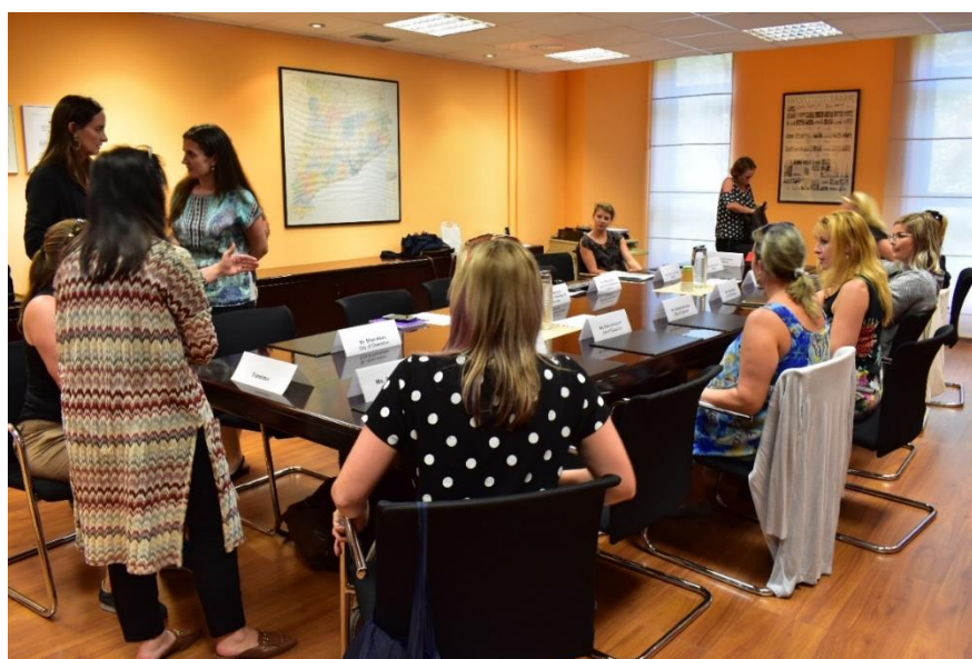
Obrázek č. 7 – jednání v regionální vládní organizaci

Agentura se snaží využívat systém předkupního práva, tímto způsobem tak získali 1000 bytů. Hlavním cílem je se zaměřit na sociálně vyloučené lokality. Dále usilují o to, aby majitelé bytů poskytli byty přímo Magistrátu, pokud tomu tak je, agentura se zaručí, že za nabídnutý byt bude pravidelně zapláceno.