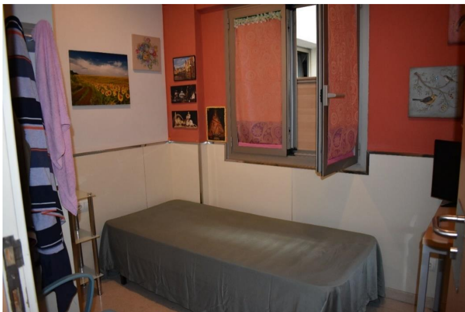
Obrázek č. 2 – jeden z pokojů v Rezidenci

Nulový byt – má k dispozici celkem 10 postelí, provozní doba je od 8 hodin. K dispozici jsou jak sociální pracovníci, tak i dobrovolníci. Klienti dostávají polévky. Nulový byt je pro všechny osoby žijící na ulici, kteří zde mohou v menší míře konzumovat alkohol. Dopředu mají vytvořený seznam lidí, kteří zde každou noc spí, max. je 13 osob pro případ, že by někdo vypadl. Jsou zde osoby, které spí i na zemi nebo na terase (je to z toho důvodu, že celý život jsou zvyklí spát na ulici), přespání je zadarmo, k dispozici 1 WC a 1 sprcha, pračka.