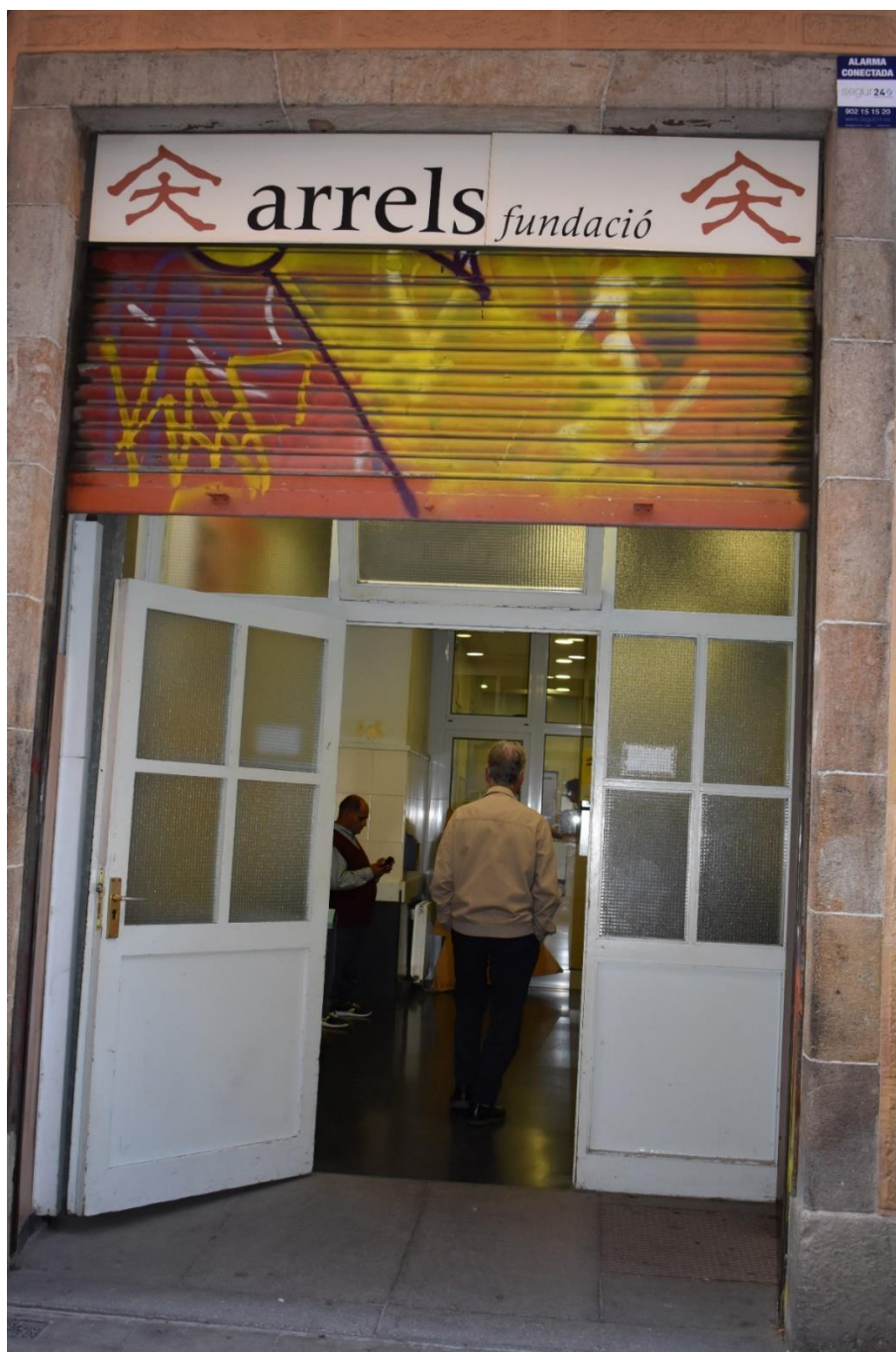
Obrázek č. 1 – nezisková organizace ARRELS

Rezidence – jedná se o domov, který poskytuje 24 hodinovou péči chronicky nemocným osobám, kteří žili na ulici. Zde má každý svůj pokoj, k dispozici je jídelna a různé aktivity. Rezidence má celkem 35 bytů, z toho 25 bytů patří magistrátu.