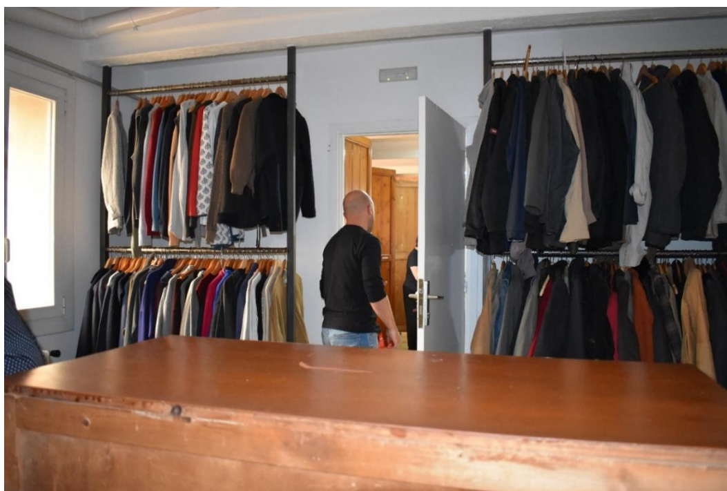
Obrázek č. 6 – sociální šatník