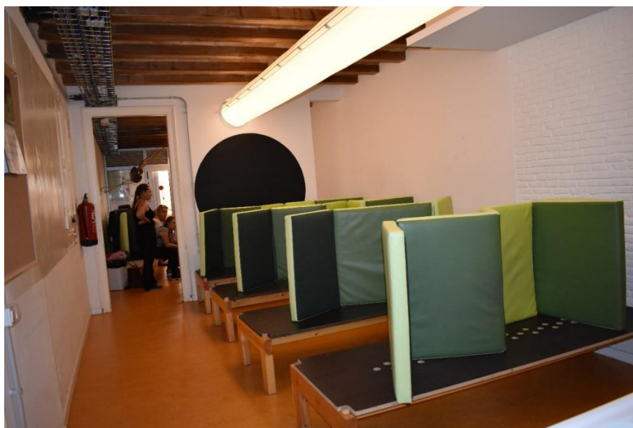
Obrázek č. 3 – postele v nulovém bytě

Nulový byt – má k dispozici celkem 10 postelí, provozní doba je od 8 hodin. K dispozici jsou jak sociální pracovníci, tak i dobrovolníci. Klienti dostávají polévky. Nulový byt je pro všechny osoby žijící na ulici, kteří zde mohou v menší míře konzumovat alkohol. Dopředu mají vytvořený seznam lidí, kteří zde každou noc spí, max. je 13 osob pro případ, že by někdo vypadl. Jsou zde osoby, které spí i na zemi nebo na terase (je to z toho důvodu, že celý život jsou zvyklí spát na ulici), přespání je zadarmo, k dispozici 1 WC a 1 sprcha, pračka.