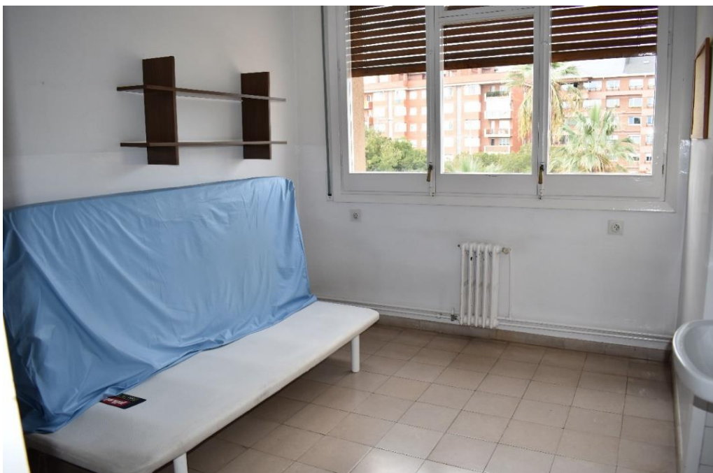
Obrázek č. 5 – prohlídka pokoje, každý pokoj má vlastní umyvadlo, skříň, postel, poličku