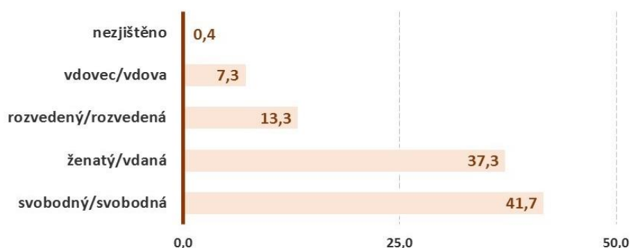
Graf č. 2 - Struktura populace města Chomutov dle rodinného stavu (k 31. 12. 2016, Zdroj: ČSÚ, SLDB 2011)

Chomutovská populace má nejvýraznější rozdíl v zastoupení ženatých/vdaných osob. Zatímco v rámci celé republiky je takových 42 %, v Chomutově tvoří 37 % podíl. Nižší zastoupení osob tak přináší relativně vyšší podíl osob svobodných – v Chomutově je takových o 2 % více než v průměru pro Českou republiku a rozvedených – v Chomutově o 3 % více než v České republice. Strukturu chomutovské populace podle rodinného stavu uvádíme v následujícím grafu.