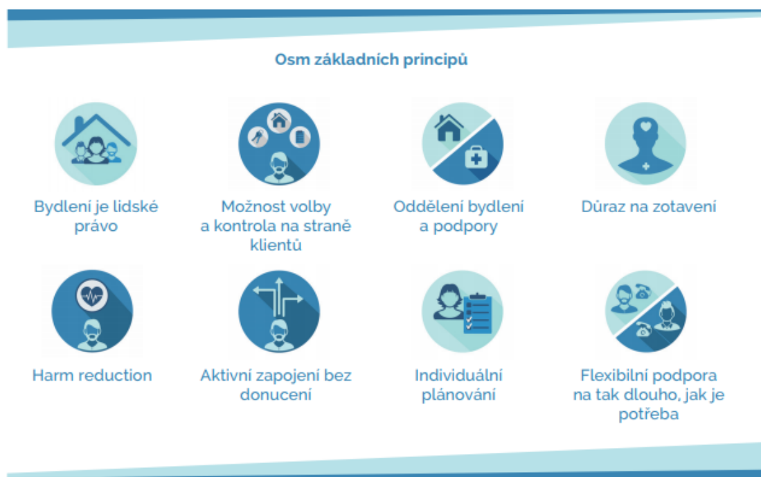
Obrázek č. 1 - Principy Housing First