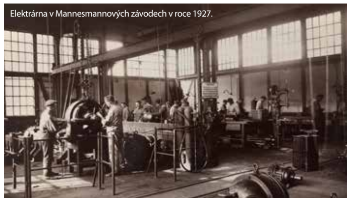
Elektrárna v Mannesmannových závodech v roce 1927.

Po polovině 19. století začal rozmach ve využívání elektrické energie. Ani české země tento trend neminul. Kolem roku 1890 zde fungovalo již více než 600 provozů produkujících elektrickou energii, většinou malých pro úzký okruh odběratelů. Nelze je srovnávat s dnešními velkými tepelnými elektrárnami. Na území chomutovského okresu vznikla první elektrárna až roku 1897, a to ve Vejprtech. Sloužila místní firmě Kl. Zahm, která se zabývala výrobou kabelů a izolovaných vodičů.