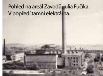
Pohled na areál Zavodů Julia Fučíka. V popředí tamní elektrárna.

O několik let později se začala elektřina vyrábět i v Chomutově. Ten zpočátku disponoval třemi většími elektrárnami. Jako první byla uvedena do provozu v roce 1900 elektrárna vybudovaná plynárenskou společností Imperial