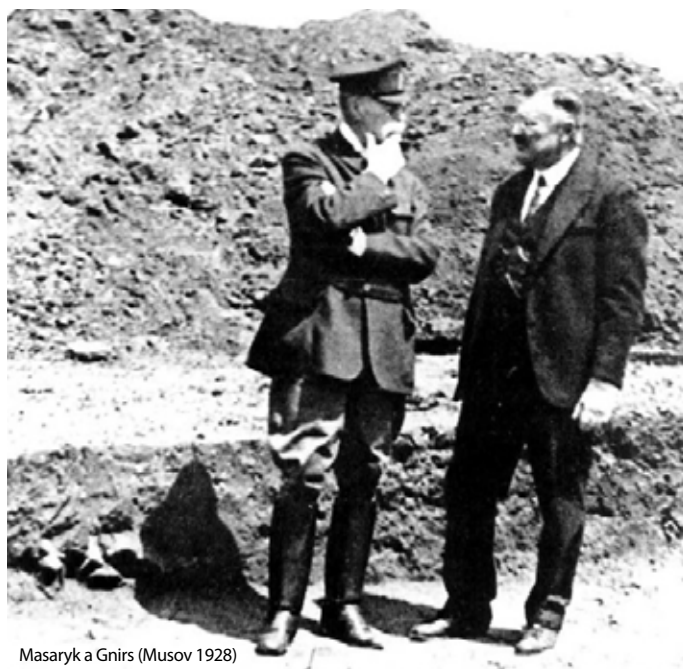
Masaryk a Gnirs (Musov 1928)