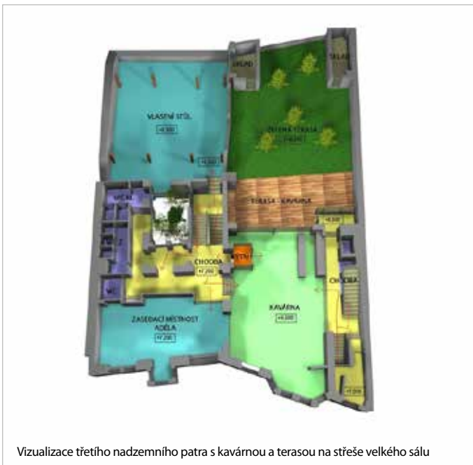
Vizualizace třetího nadzemního patra s kavárnou a terasou na střeše velkého sálu

Prostor Vlastní židle je navržen pro klienty, kteří si na nějaký časový úsek pronajmou vlastní židli. V místnosti budou umístěny stoly, židle, křesla, sedací pytle, zařízení pro tisk a kopírování, automat na kávu. Kdo si pronajme židle třeba na měsíc, bude mít jistotu, že ji vždy najde volnou. V rámci prostoru vlastních židlí se na ní pak může usadit, kam bude chtít. Židli se v tomto případě myslí také křesílko, sedací vak a podobně. V případě konání velké akce v přednáškovém sále bude prostor využíván jako foyer. Kapacita dvou propojených místností v přízemí je až 45 lidí.