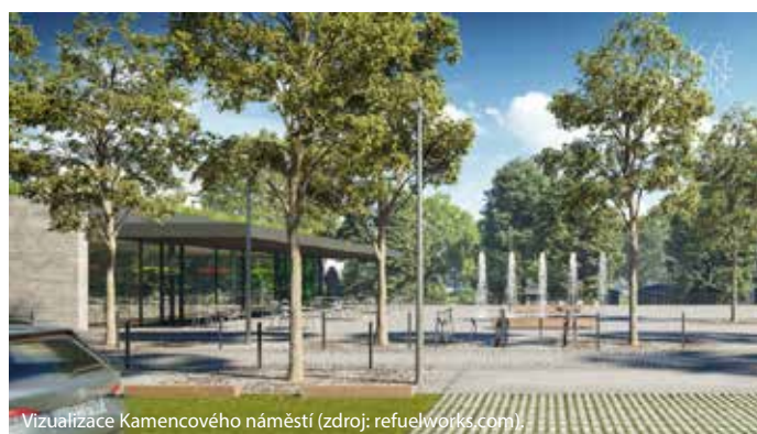
Vizualizace Kamencového náměstí.

stanou na náměstí před vstupem do areálu. To bude vybudováno v souladu s přírodním konceptem celého okolí jezera. Povrch náměstí bude z vkusných kamenných kostek, se kterými bude ladit i mobiliář z přírodních materiálů a také dřevem obložený vstupní objekt s takzvanou zelenou střechou. V budově se