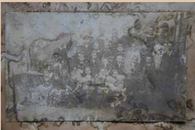
Fotografie z novosedelské meziválečné školní kroniky.