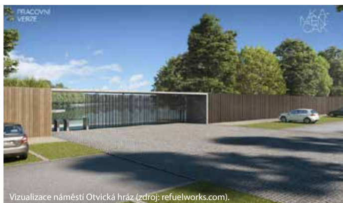
Vizualizace náměstí Otvická hráz.

Přesná výměra původní plochy není nikde zaznamenána. Ale je jisté, že jezero původně nezaujímal dnešní plochu. Tato vodní plocha vznikla po zatopení vydolovaného prostoru v období mezi roky 1813 a 1818.