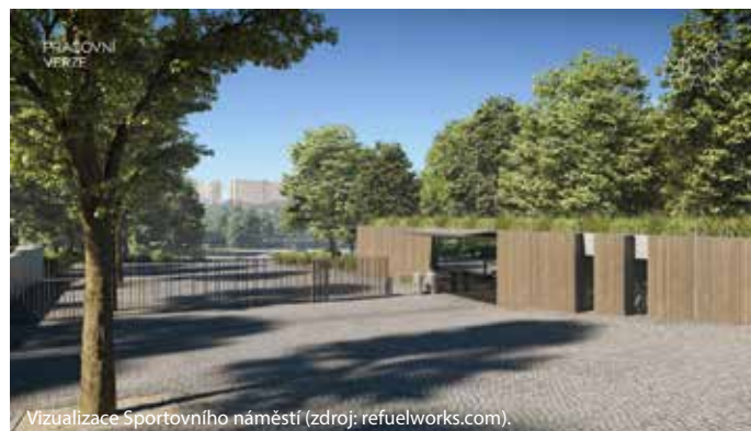
Vizualizace Sportovního náměstí.