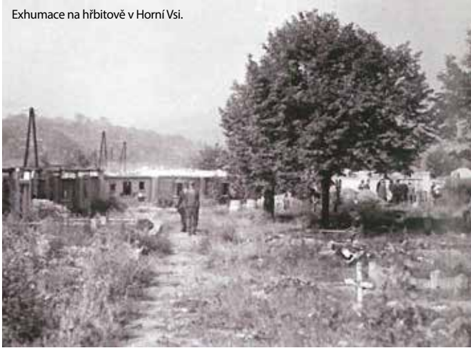
Exhumace na hřbitově v Horní Vsi.

Od ledna 1945 začali nacisté na území dnešního Polska vyklízet koncentrační tábory před postupující Rudou armádou. Jejich nedobrovolní obyvatelé museli v zimních mrazech s minimálním oblečením a při minimálních příjmech jídla pěšky urazit i stovky kilometrů. Komu během nekonečného pochodu začaly docházet síly, byl dozorující stráž bez milosti zavražděn. Na Chomutovsku se objevilo několik těchto pochodů smrti, ale jen jeden z nich prošel přímo samotným městem.