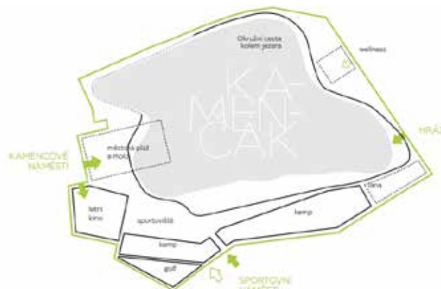
Nákres vstupů do areálu.

Zeleň bude upravená nebo nově vysazená i na jednotlivých náměstích nebo parkovištích. Například lesní parkoviště u Kamencového náměstí bude doplněné mixem různých zajímavých stromů a keřů. Pásem dřevin bude parkoviště odděleno od vilové čtvrti. Stávající trafostanice u parkoviště bude schovaná za popínávkami rostlinami.