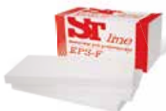
STline EPS 70F 1000 x 500 x 100 mm