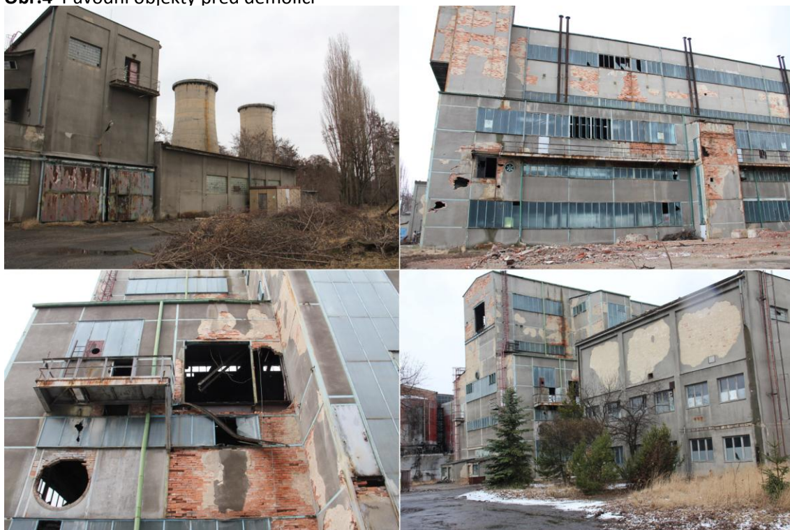
Obr.4 Původní objekty před demolicí