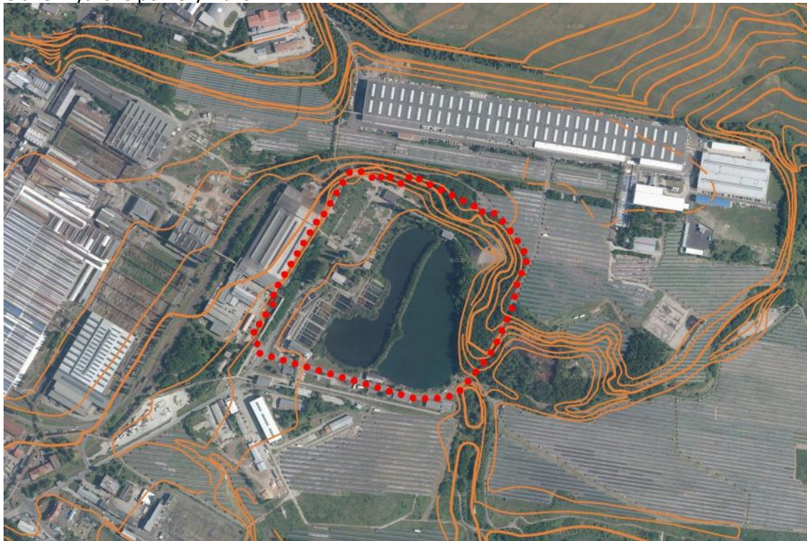
Obr.3 Výškové poměry v území

Předmětné území Z1 je tedy zcela obklopeno resp. uzavřeno průmyslovými areály s podobným využitím a podobnou budoucností, navíc v poloze terénně mírně snižené od západu a východu a výrazně snižené oproti severním pozicím Zadních Vinohrad. Navýšení hmot ve Z1 nebude mít vliv na celkovou výškovou hladinu zástavby v absolutní nadmořské výšce.