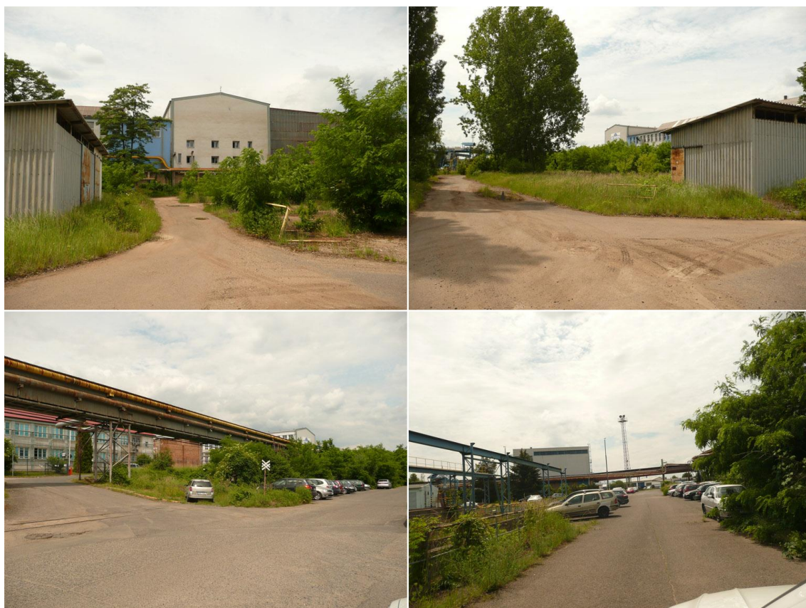
Obr.5 Stávající objekty v okolí