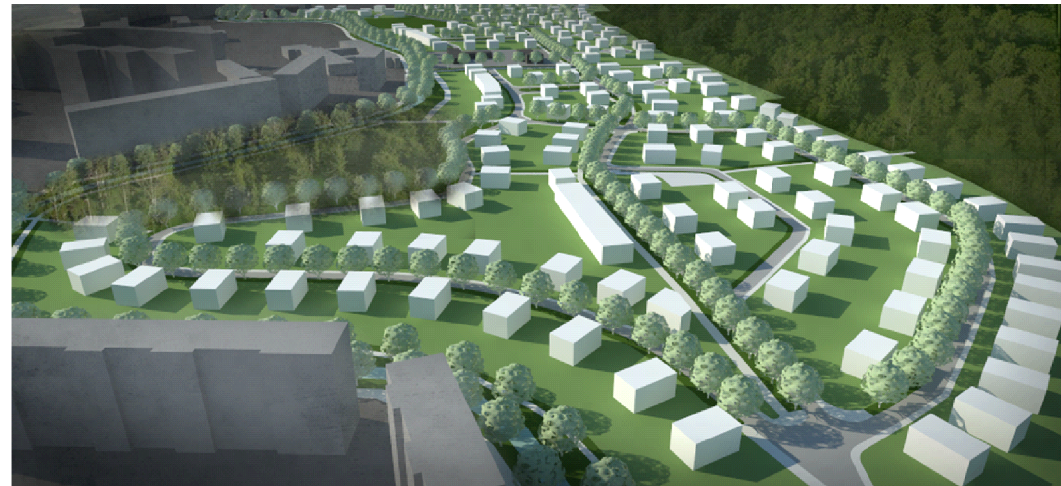
Pohled z východu