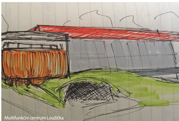
Multifunkční centrum Loužička