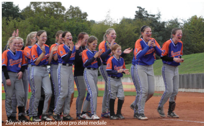
Žákyně Beavers si právě jdou pro zlaté medaile

Zatímco dospělí softbalisté SC 80 Beavers Chomutov v souvislosti s generační obměnou trochu ustoupili z pozic, na výsluní je bohatě nahradila mládež.