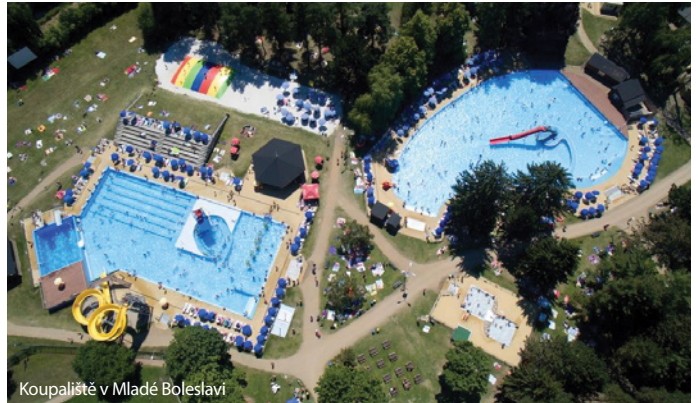
Koupaliště v Mladé Boleslavi