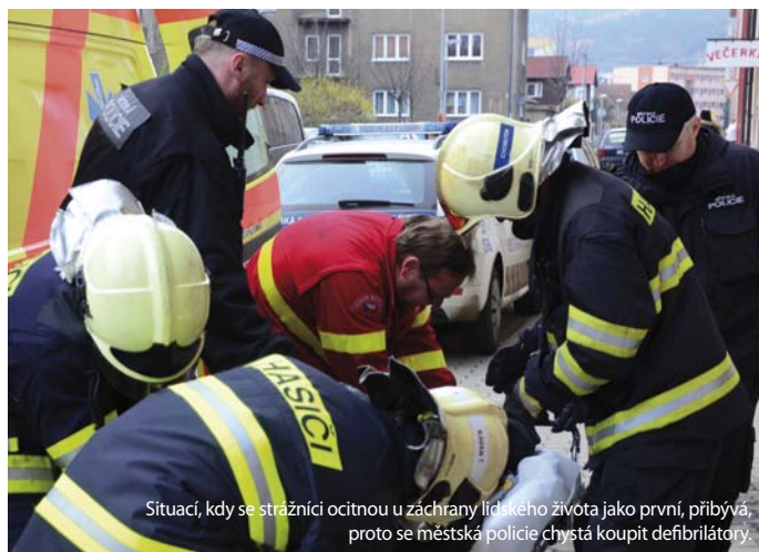
Situaci, kdy se strážníci ocitnou u záchrany lidského života jako první, přibývá, proto se městská policie chystá koupit defibrilátory.

Změny nastanou i v otázce školení. Ta budou intenzivnější, často nad rámec zákonné povinnosti. Například co se výuky sebeobrany týče, nově ji odborník povede tak, aby korespondovala se skutečnými zákroky v ulicích.