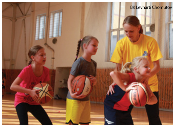
BK Levharti Chomutov