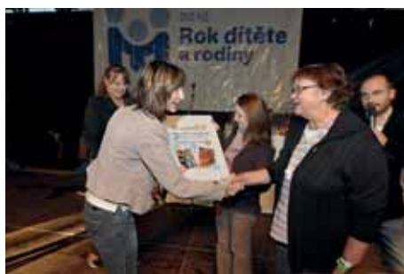
Nejlepším organizátorem bylo SKKS, jehož zástupkyně získaly ocenění za akci Tajuplná noc v knihovně.

Jak hodnotí primátorka města celý projekt Rok dítěte a rodiny?