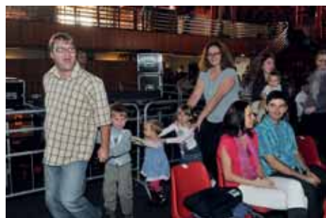
Písnička Maxim Turbulenc Jede, jede mašinka zvedla lidi ze židlí.