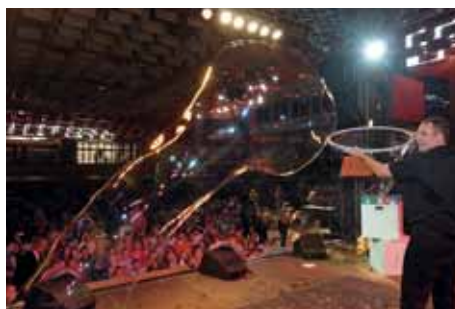
Překvapením byla pro děti bublinová show.