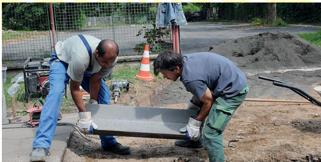
Dělníci budují příjezd na parkovací plochu u taneční školy.

Řidičům bydlícím v okolí taneční školy Stardance a rodičům, kteří vozi děti na hodiny tance, se podstatně zlepši možnosti parkování. Na požadavek lidí řešit neutěšenou situaci s parkováním radnice zareagovala a na zahradě školy vybudovala manipulační plochu k parkování. U školy tak přibýlo jedenačtyřicet parkovacích míst, z nichž jsou dvě pro tělesně postižené. Plocha k parkování vznikla za dva týdny a městskou kasu vyšla na necelých čtyři sta tisíc korun. V blízkosti školy již město nechalo zjednotřit Roháčovu, Erbenovu a Havlíčkovu ulici, čímž přibýla další místa.