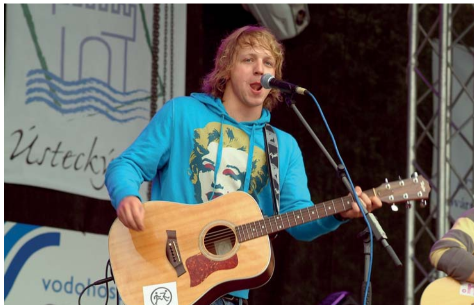
Zpěvák Tomáš Klus.

Léto je obdobím festivalů a Chomutov nezůstal pozadu. Přestože lilo jak z konve, na sedmém ročníku festivalu Kamenčák to vřelo. A mělo proč. Nabitý program přilákal přes patnáct set lidí, kteří se postupně dostávali do festivalového varu. Frontmana skupiny MIG 21 diváci nakonec doslova vyfukovali.