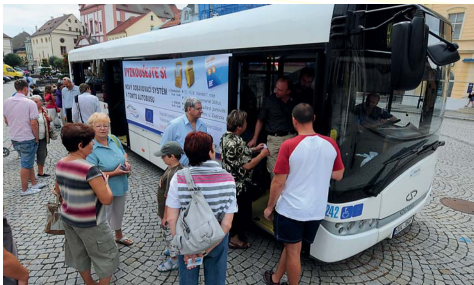
Cestující si mohli nový odbavovací systém vyzkoušet v autobuse na náměstí.