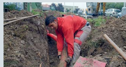
Dělník pokládá do země optické kabely.

Již brzy bude mít městský kamerový dohlížecí systém osmadvacet kamer. Sedm nových jich přibude na sídlištích v rámci projektu IOP Sídlíště, místo pro život. „Podaří se nám tak zase zvýšit bezpečnost obyvatel především proti pouliční kriminalitě,“ řekl náměstek primátorky Jan Řehák. V rámci projektu se systém kamer nejenže rozšíří, ale přejde plně na digitální provoz a většina kamer se připojí na optickou síť. „Tím se podstatně rozšíří kapacita a možnosti celého systému. Zároveň se vybuduje nové operační pracoviště městské policie, odkud se řídí celý chod kamer i ostatních systémů pro řízení služby,“ řekl Josef Skalický, vedoucí technického oddělení městské policie. Město do systému investuje 9,5 milionu korun, větší část však jde z fondů Evropské unie. Přechemem na plně digitální technologii se systém kamer stane volně rozšiřitelným. V blízké budoucnosti městská policie počítá s tím, že se napojí nejen na kamerový systém umístěný v nově vznikajícím areálu na Zadních Vinohradech, ale i na kamery umístěné přímo v novém zimním stadionu. „To nám umožní v době zápasů sledovat přes kamery bezpečnostní situaci a včas zasáhnout například proti nepokojným fanouškům,“ dodává Skalický.