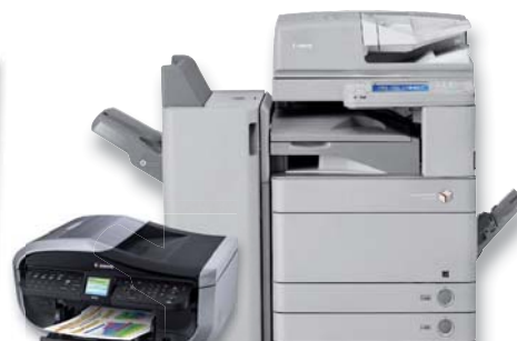
kancelářská a kopírovací technika