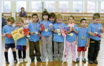
Vítězné družstvo z mateřinky Pohádka.