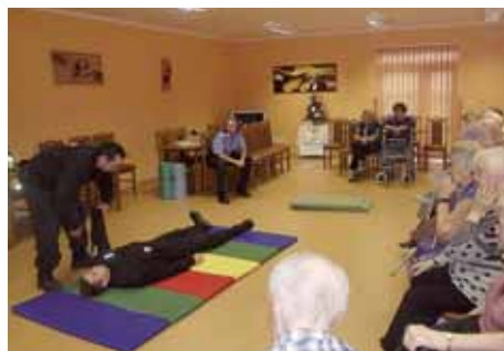
Prezentace bojových umění pro seniory.

pochopitelně strážníci názorně ukázali. Jedna ze starších dam pak trefně a sebevědomě poznamenala: „Nejvic se mi líbilo to kopnutí do genitálií. Tím bych útočníka jistě odradila.“ Je pochopitelné, že sklidila bouřlivý aplaus přítomných.