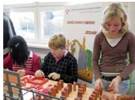
I skutečný dům z cihel je vlastně stavebnice.

Víte, co dělá čalouník, klempíř, tesař nebo třeba mechatronik? To byly otázky, které na deváťáky čekaly nejen v samotné budově střední školy, ale také v objektech dílen odborného výcviku Na Moráni. „Součástí ukázek jednotlivých oborů byla také možnost vyzkoušet si některé pracovní postupy,“ doplnil ředitel Mareš. Budoucí zedník tedy skládal zeď z kostek stavebnice, instalatér šrouboval ocelové trubky, čalounice šily polštářky, truhlář hobloval. Každý ze žáků si tak mohl na vlastní kůži vyzkoušet, co jednotliví řemeslníci dělají a jaké nástroje k tomu potřebují. „Pro 9.A a 9.B Základní školy Na Příkopech budou další prezentace připraveny v prosinci 2009 a v lednu 2010. Mezitím ale všechny ostatní zájemce o vzdělávání v našich