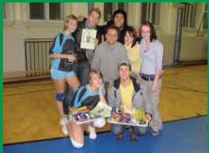
Týmy soukromého gymnázia Diskalkul a (J)elita.