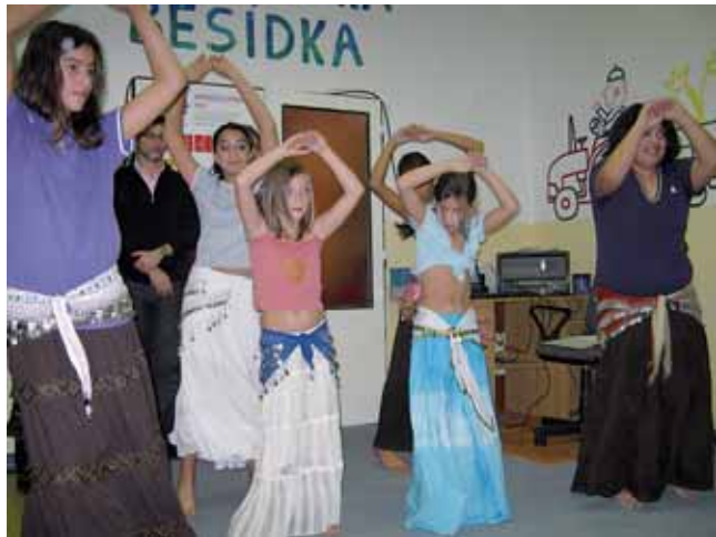
Orientální tanec v podání děvčat ze sídliště