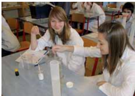
Žákyně ani při náročných pokusech neztrácely dobrou náladu.

Projektové dny na nejrůznější témata se v posledních letech velice osvědčily jako vítané zpestření výuky také na chomutovských školách. „Žáci 8.A ze základní školy v ulici