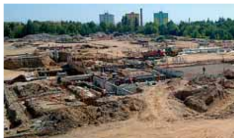
Výstavba nového zimního stadionu

Oddíl atletiky má na krajské úrovni obrovské úspěchy. O tom svědčí i řada zlatých medailí z přeborů. Někteří naši atleti slaví úspěchy i na republikové úrovni. Bohužel je smutnou skutečností, že ti nejlepší z našich sportovců trénují a závodí za jiné oddíly, které mají lepší zázemí. Město dostatečně ohodnotilo výkony atletů tím, že do