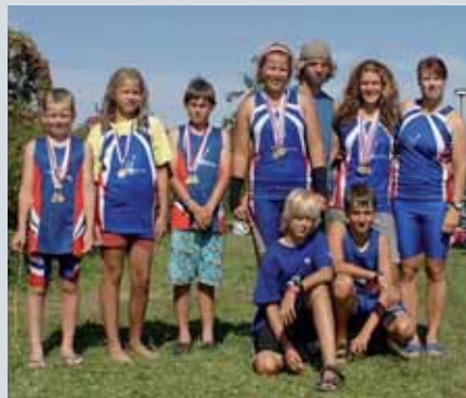
Část týmu s medailemi