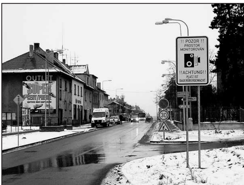
Také v Kadaňské ulici jsou již umístěny varovné cedule.

Problémy se objevují stejně jako v litvínovském Janově v chomutovských sídlištích, kde bydlí romská menšina. Město jí již před časem podalo pomocnou ruku tím, že do ní vyslalo terénního pracovníka, který pomáhá občanům v nesnázích jejich problémy řešit. Situace se ale bohužel postupně vyhorčuje. Mezi starousedlíky se přistěhovávali noví Romové z celé ČR, z nichž někteří nehodlají respektovat zákony. Město se snaží získat finanční prostředky na činnost většího počtu terénních pracovníků. (tb)