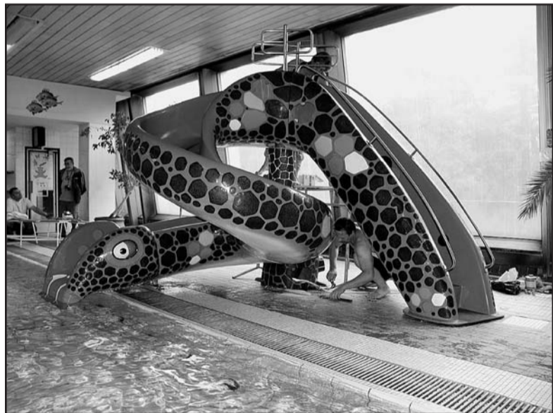
Šestimetrová skluzavka zvaná Kobra je od nynějška k dispozici malým návštěvníkům Městských lázní v Chomutově, jejichž vedení o záměru pořádit tuto atrakci informovalo v červencových Chomutovských novinách. Na snímku skluzavku u dětského bazénu instalují pracovníci odborné firmy.

produkuje typický asijský styl hry, který nám moc nesedí,“ okomentoval Jan Bobrovský soupeře ze základní skupiny MS. (sk)