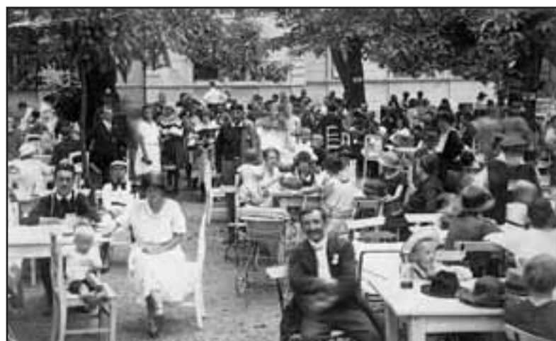
V Kaštance kdysi bývala restaurace. Jak je vidět na snímku, byla i hojně navštěvována.

starých stromů zabraňuje rozpadu kosterních větví redukcí obvodu koruny, podporuje existenci a postupné zakřeňování spodních větví, podporuje přirozené procesy průběhu infekce ve kmeni a kosterních větvích stromu z důvodu vzniku niky pro život dalších organismů, nezabývá se čištěním a konzervací ran a dutin, podporuje rozklad dřevní hmoty v blízkém okolí ošetřovaných stromů,“ uvedla Hana Pite-