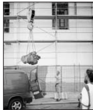
Restaurátor Jaroslav Jelínek dohlíží, aby se pomocí jeřábu vázy šetrně sejmuty z kostela.

Dvě dekorativní vázy, umístěné na severním štítu kostela svatého Ducha Pravoslavné církve v Hálkově ulici, jsou natolik v havarijním stavu, že musely být z souhlasem Národního památkového ústavu sejmuty pomocí jeřábu a odvezeny do ateliéru k restaurování. Do opravy kostela investovalo město letos půl milionu korun, krajský úřad přispěl částkou 1 115 000 Kč. „Když se postavilo řešení, zjistili jsme, že jsou tyto vázy ve velmi špatném stavu. Za tři sta let železný trn zcela roztrhl pískovcový prvek, který byl na ni nasazen. Již v minulosti se naši předchůdci pokoušeli vázy opravit tím, že je spoutaly železnou obručí. Ta se ale také rozpadla a rozměrné prvky hrozí zřícením,“ vyjádřil se městský architekt Jaroslav Pachner a dodal, že zrestaurované vázy budou umístěny v lapidáriu Oblastního muzea v Chomutově a na průčelí kostela se vrátí jejich kopie. „Barokní vázy jsou umělecky velice cenným prvkem, jejich bohatý dekor však není v tak velké výšce pomalu ani vidět. Jejich zdobení je přitom mnohem bohatší než na těch vázách, které jsou dnes umístěné před vstupem do chomutovské knihovny či na schodišti zámku Červený Hrádek,“ doplnil architekt Pachner. (mile)