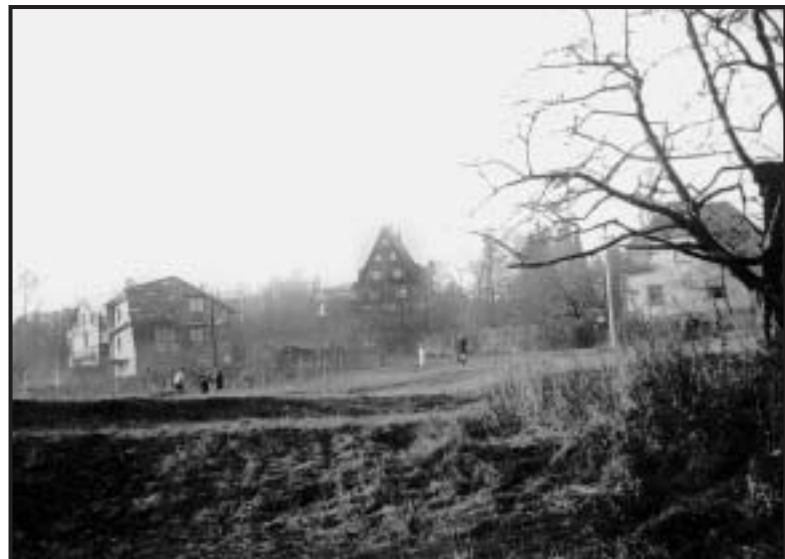
Oblast staré zástavby na Zátíší zachytil před lety snímek Jiřího Klímy.

Dnešní pojmenování vychází zřejmě ze skutečnosti, že donedávna byla z této ulice poměrně pěkná vyhlídka na velkou část města a jeho okolí. Nyní je zde zástavba rodinných domků a rozhled je již omezen také vzrostlými zahradními stromy. (klíma)