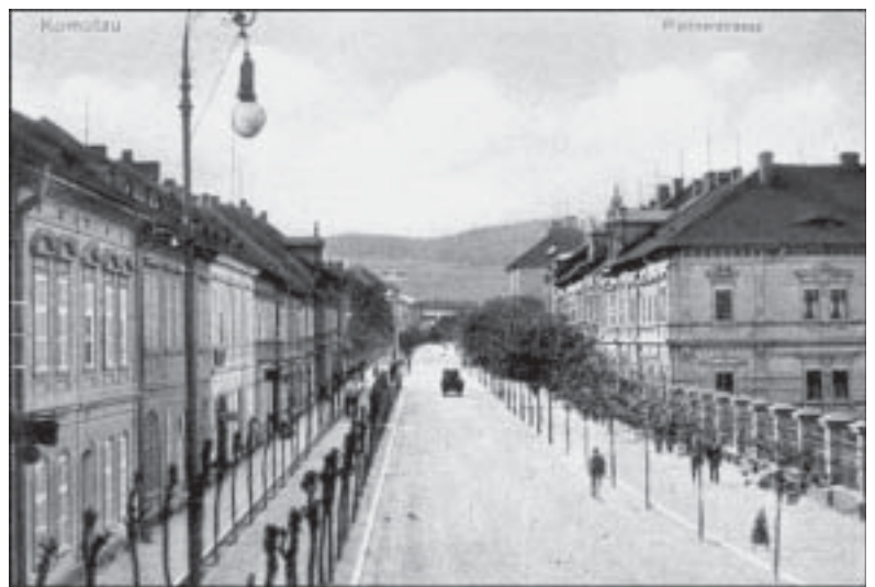
Blatenská ulice v dobách, kdy nesla název Plattnerstrasse.

proto říkalo „Zatopená“ nebo „Mokrá čtvrť“. Za druhé světové války měla krátce i název Hermann Göring Str., po říšském maršalovi a Hitlerovu zástupci, vojensky málo úspěšném veliteli Lufwaffe Wilhelmu Hermannu Göringovi (1893-1946). Část ulice od křižo-