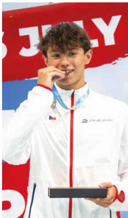
EYOF Skopje 2025.

Dřív to byl problém, hlavně když jsem byl mladší. Teď už jsem si na to zvykl a nevdá mi to tolik. Prostě vím, že to k tomu patří.