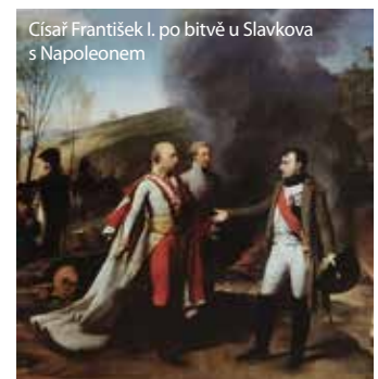
Císař František I. po bitvě u Slavkova s Napoleonem