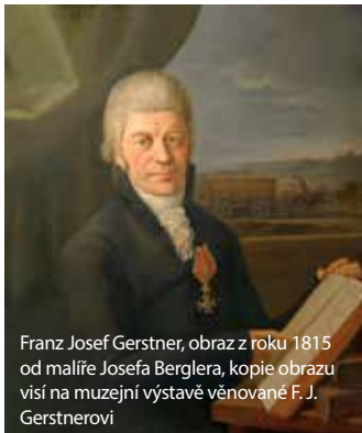
Franz Josef Gerstner, obraz z roku 1815 od malíře Josefa Berglera, kopie obrazu visí na muzejní výstavě věnované F. J. Gerstnerovi

Každé město má rodáky, na které může být náležitě hrdé. Chomutov jich má celou řadu, ale tím nejznámějším je Franz Josef Gerstner, osobnost ve vědeckém a akademickém světě, o to významnější, že nebyl jen teoretikem, ale i praktickým inženýrem.