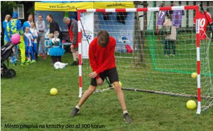
Město přispívá na kroužky dětí až 800 korun