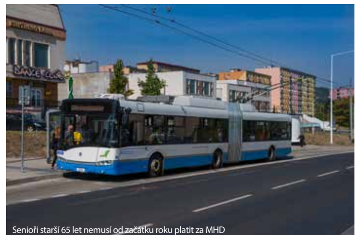
Senioři starší 65 let nemusí od začátku roku platit za MHD