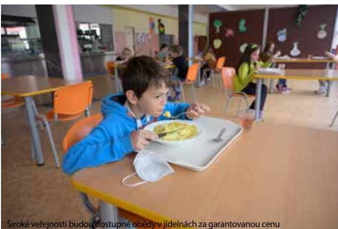
Široké veřejnosti budou dostupné obědy v jídelnách za garantovanou cenu

Další pomoc v ekonomické krizi se týká fixace nájmu v městských bytech, ten se tedy v letošním roce nezvyšil. Plošně město pomůže všem obyvatelům zavedením sítě jídelen, které nabídnou veřejnosti obědy za dostupnou a garantovanou cenu. Přehled těchto jídelen se ještě připravuje.