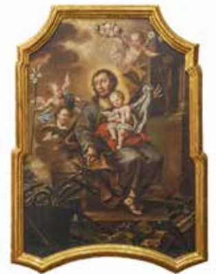
Sv. Josef s Ježíškem (OMG Most)