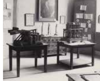
Výstava v Městském muzeu v Chomutově v roce 1932

Mgr. Jiří Kopica, Oblastní muzeum v Chomutově