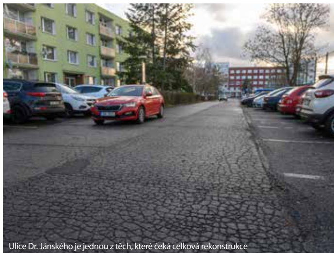
Ulice Dr. Jánského je jednou z těch, které čeká celková rekonstrukce