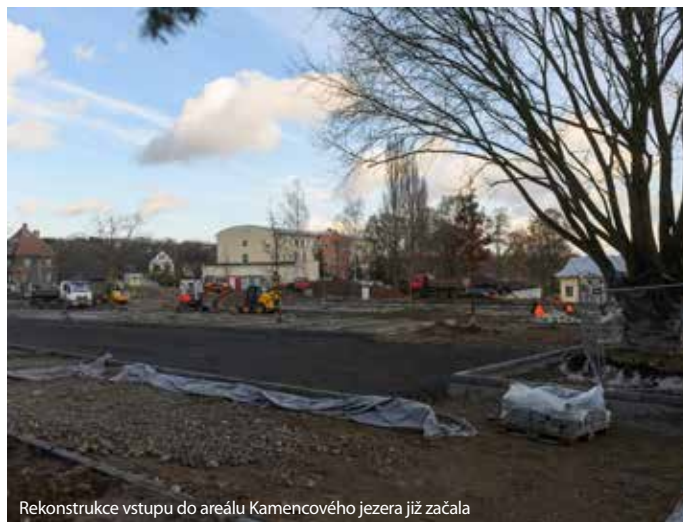
Rekonstrukce vstupu do areálu Kamencového jezera již začala