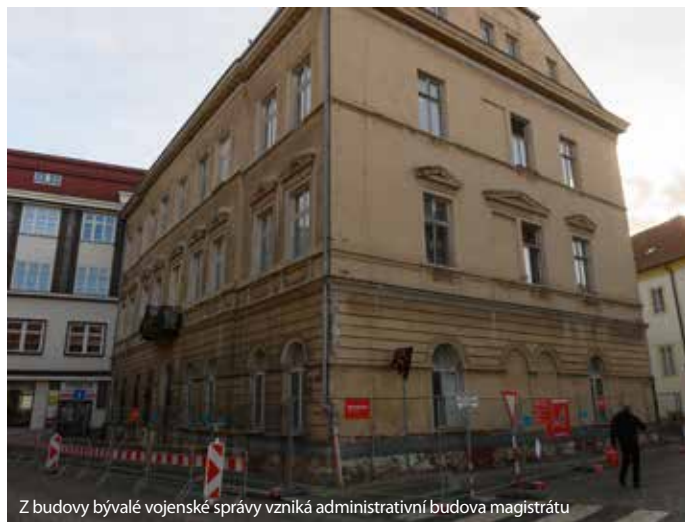
Z budovy bývalé vojenské správy vzniká administrativní budova magistrátu

Aby město ulevilo potřebným lidem v současné ekonomické krizi, připravilo osmičku různých pomoci. Kromě zmiňovaných úlev na poplatek za odpad, MHD a příspěvku na volnočasové aktivity se opatření týká i zavedení sítě jídelen, které nabídnou veřejnosti obědy za dostupnou a garantovanou cenu. Děti z rodin ve finančních obtížích navíc budou mít obědy zcela zdarma. Dále v městských bytech nebude zvýšeno nájemné.